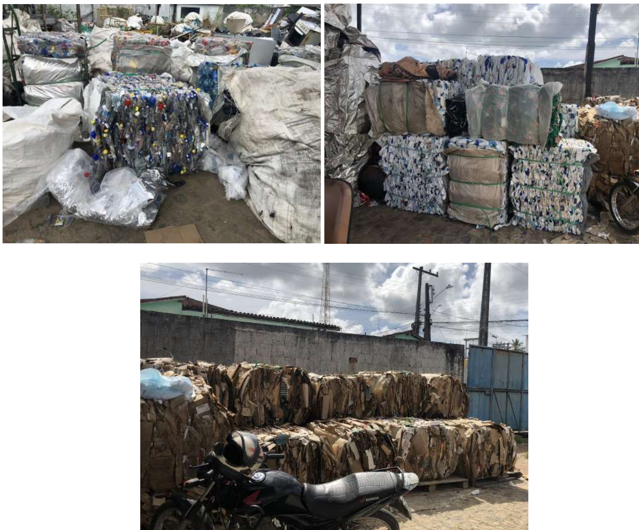
Figura 1 – materiais recicláveis separados na OM e destinados à cooperativa local.