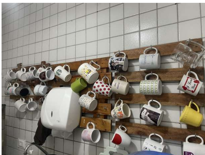
Figura 2 – local destinado a acondicionamento de canecas do efetivo visando à redução do consumo de copos descartáveis.