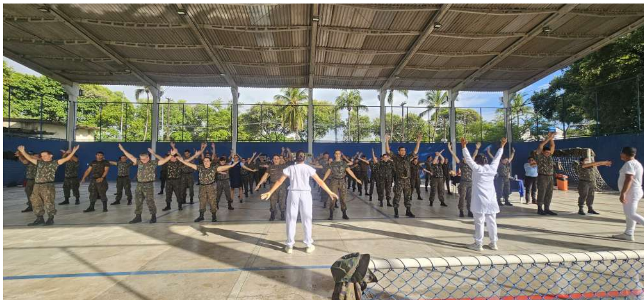
Figura 5 – atividade do programa “Acolhendo o acolhedor”, promovendo o incentivo à prática de atividade física ao efetivo.