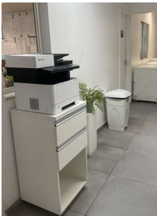
Figura 3 – impressora central para uso do efetivo em geral, com acesso por código individual, permitindo monitoramento de indicadores.