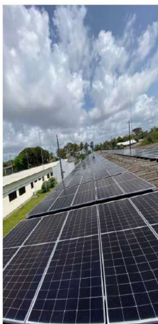
Figura 4 – instalação de usina fotovoltaica em edificação do HARF, viabilizando redução no consumo de energia elétrica do complexo HARF-OARF.